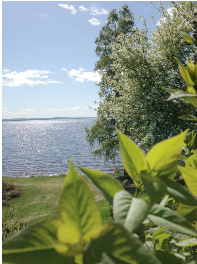
Stiftsgården Rättvik 18 Maj