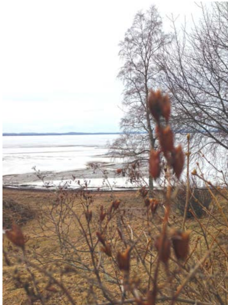
Stiftsgården 19 april