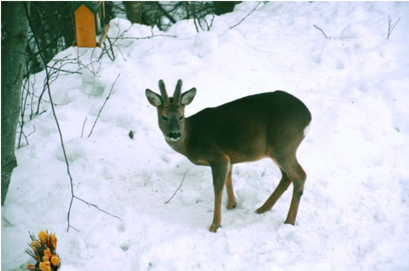
Rådjur i Säter