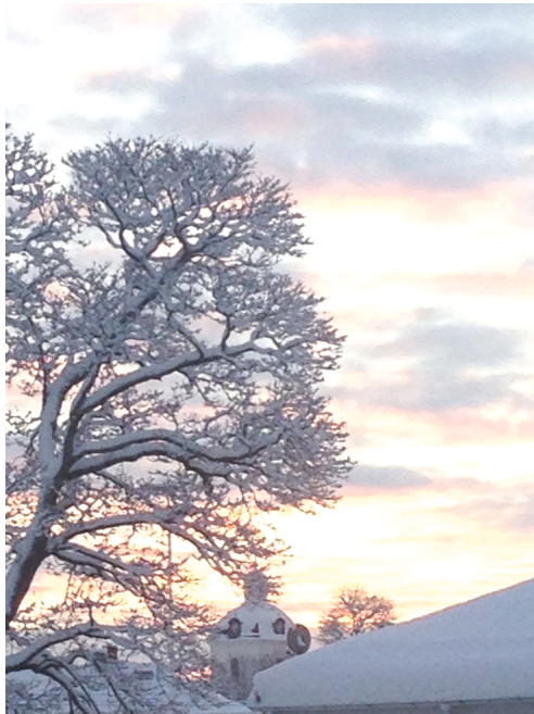
Vintermotiv i Säter