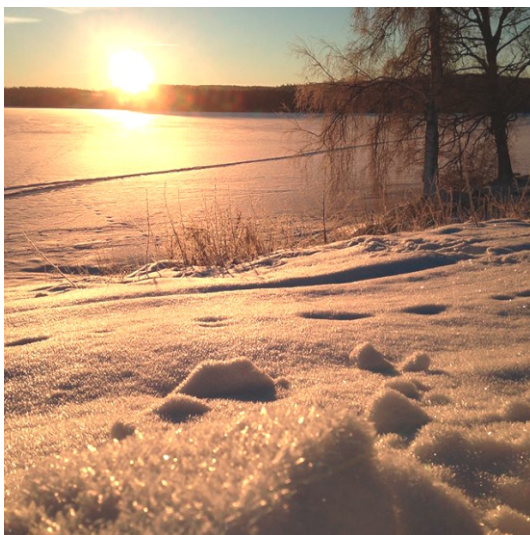
Sjön Ljustern